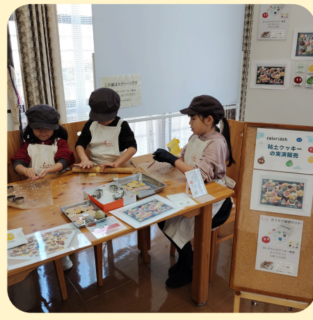
（参考）ジュニア社長の実践現場 小学生向けの事例（年齢幅広く対応）