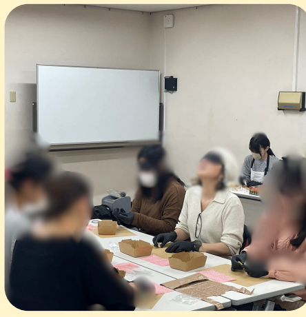
新たな感覚を体感する参加者