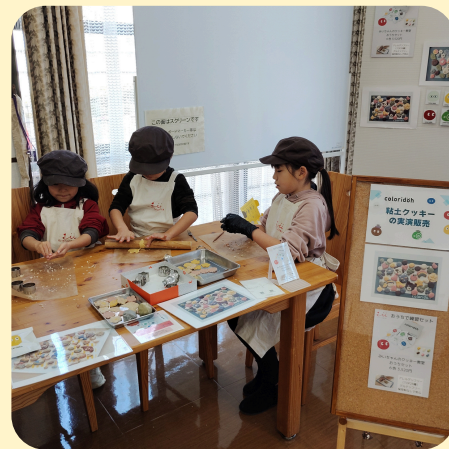
（参考）ジュニア社長の実践現場 小学生向けの事例（年齢幅広く対応）